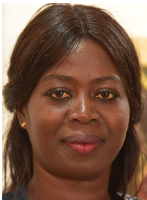
og familiens fordømmelse

Kiné Aw kender flere kvinder, der gerne vil være kunstnere, men som ligger under for samfundets